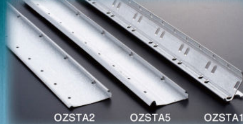
OZSTA2 OZSTA5 OZSTA15