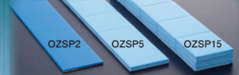
OZSP2 OZSP5 OZSP15