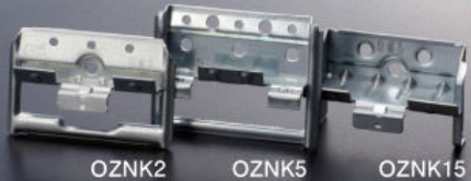
OZNK2 OZNK5 OZNK15